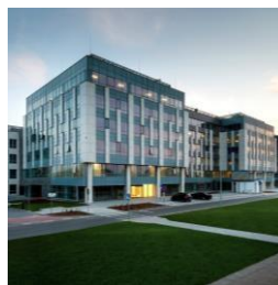
Astrum Business Park Varšava