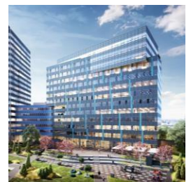
Lakeside Park 02 Bratislava