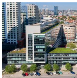
BBC1 & BBC1 Plus Bratislava