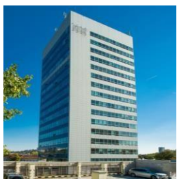
Westend Tower Bratislava